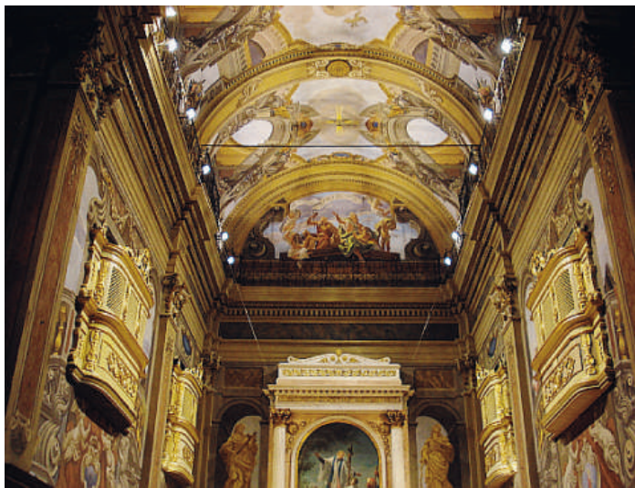
Una precedente visita per le "Giornate europee del patrimonio"

PIACENZA - Iniziative anche nei musei in occasione delle Giornate europee del patrimonio , accanto agli appuntamenti in programma oggi alle 10 all'Archivio di Stato a Palazzo Farnese, con l'iniziativa Frammenti di Paradiso . Sopra un commento dantesco di fine Trecento, cui parteciperà il filologo Fabrizio Franceschini, dell'università di Pisa, e dalle 15.30 alle 18.30 in Cattedrale, con conversazioni e visite guidate. Oggi i Musei civici di Palazzo Farnese saranno aperti gratuitamente dalle 10 alle 13, dalle 15 alle 19 e, in via straordinaria, dalle 21 alle 23, con possibilità di effettuare offerte a favore delle zone alluvionate. Per i bambini dai 3 agli 8 anni è in programma un laboratorio ludico-creativo gratuito (fino a esaurimento posti), nell'ambito del progetto Exponiamoci . Nella Cappella ducale alle 17, in collaborazione con Unicredit art collection, verrà presentata l'installazione Chinese theatre dell'artista Patrick Tuttofuoco, che illustrerà al pubblico l'opera - una struttura per proiezioni con ventidue sedute - concessa in prestito da Unicredit e originariamente concepita per il museo d'arte moderna di Bologna all'interno del progetto