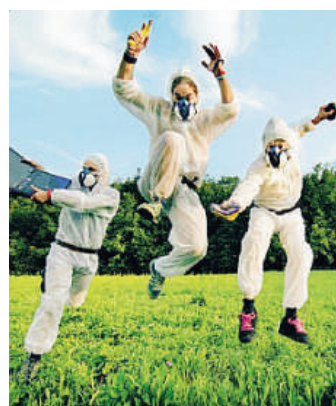
Eteera Post Bng band, tra i gruppi partecipanti al Festival

doneon: 30 anni in 9 mq. Una selezione folle di abiti e accessori dagli anni '50 agli '80. Spazio poi alle etichette. In mostra la Desert Fox Records, che accoglie una serie di band piacentine. Si potranno ammirare le illustrazioni di Emanuela Cafferini collaboratrice di Burpl, Sonnambulo, Damage comix ed editori di fumetti (Double Shot, Proglo, Bookmaker), che lavora con riviste, privati e siti web come illustratrice per l'infanzia. Sempre illustrazioni col laboratorio Foglie al Vento di A-