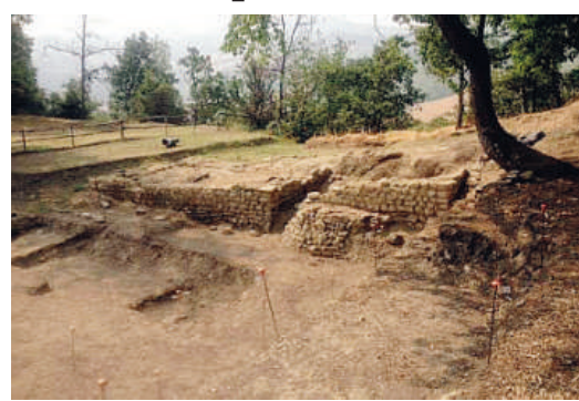
Da domenica visite guidate alla Piana di San Martino, nel comune di Pianello